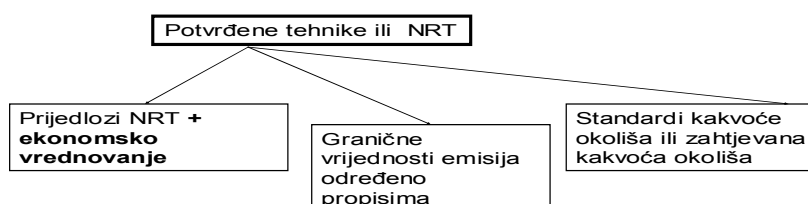
Sl.3.2. Način izbora NRT-a s provedenim ekonomskim potvrđivanjem

Situacija se međutim može usložniti tamo, gdje se predložene tehnike ne nalaze u sektorskim RDNRT. Takav se slučaj može prikazati na sljedećoj slici (sl. 3.2.) gdje se prijedlozi NRT odnose na tehnike koje nisu potvrđene kroz RDNRT i čije je ekonomsko vrednovanje (potvrđivanje) potrebno provesti prilikom određivanja NRT-a. Do sličnih stanja može doći i kod graničnih slučajeva primjene sektorskih RDNRT-a.