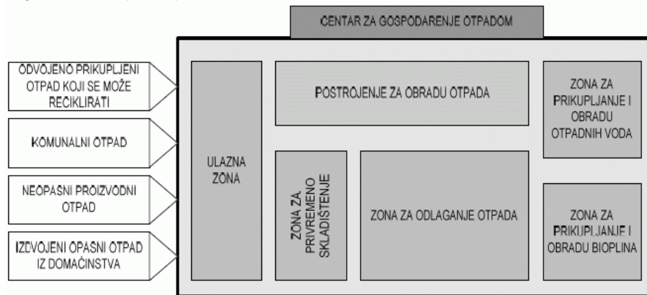
Slika 2 Sadržaj CGO-a i tijek otpada